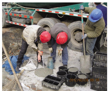
砼坍落度检查照相记录