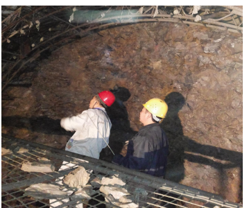
监理在工作面验收导管格栅支护

2016年4月6日,中国进出口银行有关领导就阿尔及利亚中心港项目对大连理工大学土木建筑设计研究院有限公司进行实地考察,陪同单位有中建股份阿尔及利亚公司和中建港务建设有限公司。本次考察团来访的主要目的是考察设计院能力、业绩等情况,同时对学校各研究机构对项目的支撑能力进行评估。